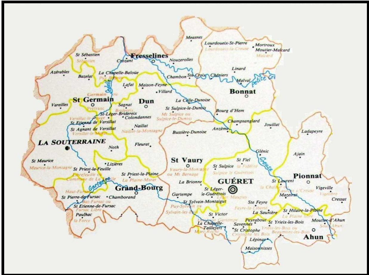
Figure 13 Arrondissement de Guéret. Extrait de Carte du département de la Creuse et ses divisions administratives pendant la période révolutionnaire de 1790 à l'an III . Par Ernest Aureix et Maurice Dayras, publiée par la Société des Sciences naturelles et archéologiques de la Creuse et par le Comité départementale d'Histoire de la Révolution.

L'arrondissement de Guéret englobe les anciens districts de Guéret et La Souterraine.