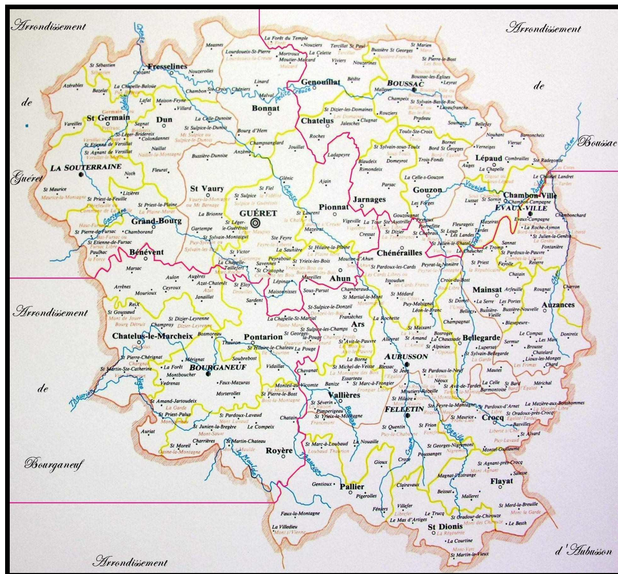
Figure 9. Les arrondissements. Extrait de Carte du département de la Creuse et ses divisions administratives pendant la période révolutionnaire de 1790 à l'an III . Par Ernest Aureix et Maurice Dayras, publiée par la Société des Sciences naturelles et archéologiques de la Creuse et par le Comité départementale d'Histoire de la Révolution.