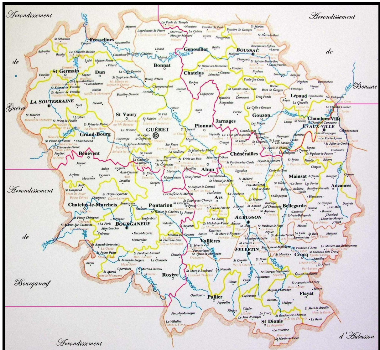
Figure 9. Les arrondissements. Extrait de Carte du département de la Creuse et ses divisions administratives pendant la période révolutionnaire de 1790 à l'an III . Par Ernest Aureix et Maurice Dayras, publiée par la Société des Sciences naturelles et archéologiques de la Creuse et par le Comité départementale d'Histoire de la Révolution.