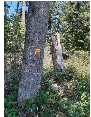
Nos baliseurs à l'œuvre