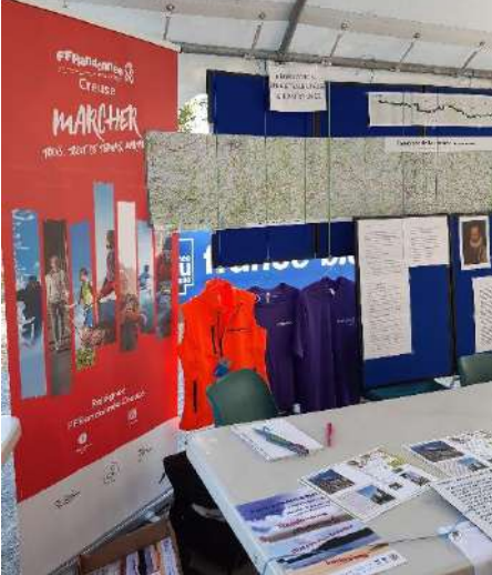
Journée du livre Felletin-08/2022