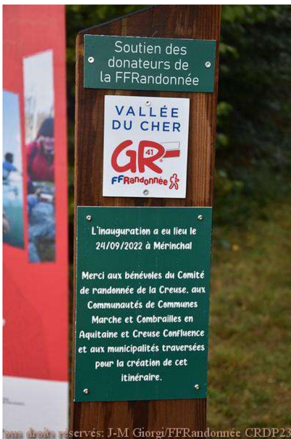
Inauguration du GR®41

Départ : 7h30 à 9h salle des fêtes ROCHES