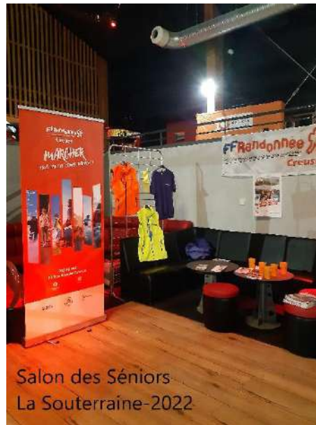
Salon des Séniors La Souterraine-2022