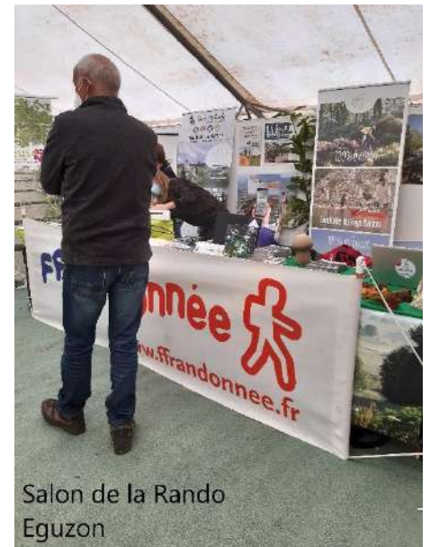
Salon de la Rando Eguzon