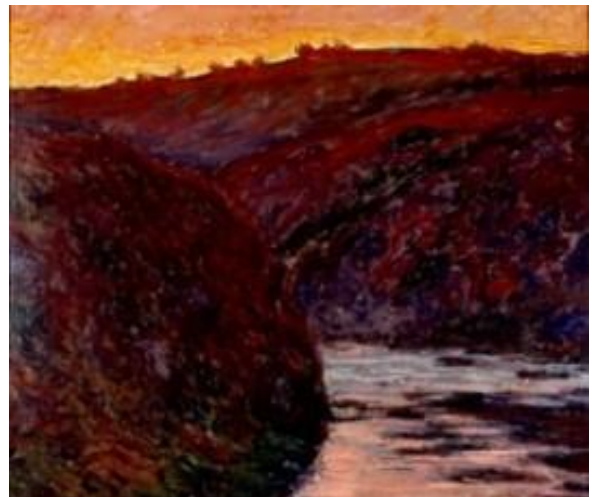
Claude Monet, Paris, 1840 – Giverny, 1926 La Vallée de la Creuse, soleil couchant, 1889 Huile sur toile Musée Unterlinden Colmar. Achat, 1975, Inv. 88.RP.378