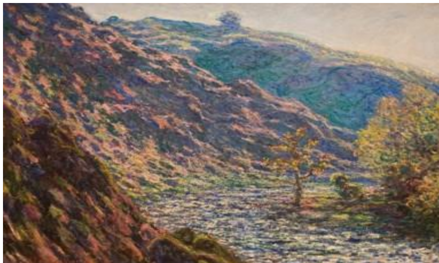
Rivière la petite Creuse

Le 21 juin 1889, les toiles réalisées à Fresselines seront présentées au public lors de l'exposition conjointe Monet-Rodin qui s'ouvre à Paris à la galerie Georges Petit. Aujourd'hui, ces peintures sont dispersées de par le monde dans des musées ou appartiennent à des collections privées.