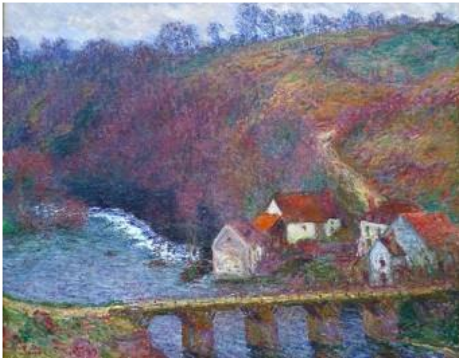
Grande Creuse – Pont de Vervy

Pourtant Monet pense au printemps de Giverny, si doux, si serein. Il termine consciencieusement ses tableaux et quitte la Creuse les 18 ou 19 mai. Il emmène avec lui le travail considérable d'au moins vingt-trois toiles. Il y a là dix vues des Eaux-Semblantes avec le Bloc. (...) Quatre vues du vieil arbre (le malheureux effeuillé), trois du moulin de Vervy, trois du hameau de la Roche-Blond et deux Petite Creuse sans ciel. (...)