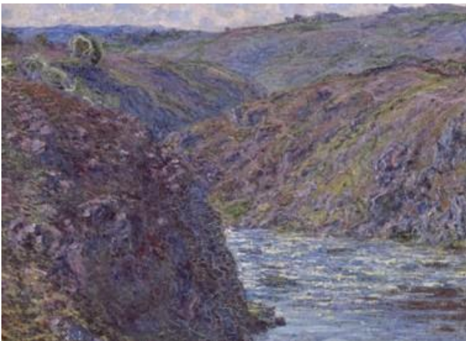
Ravin de la Creuse, Musée de Reims

Début mai, nouveau drame : les premières feuilles apparaissent. La série du vieil arbre, sentinelle noueuse du confluent, n'est pas terminée. Et pas question de changer les tableaux qui sont des paysages d'hiver. Alors, le plus naturellement possible, Monet propose cinquante francs au propriétaire de l'arbre pour faire arracher les jeunes pousses. (...)