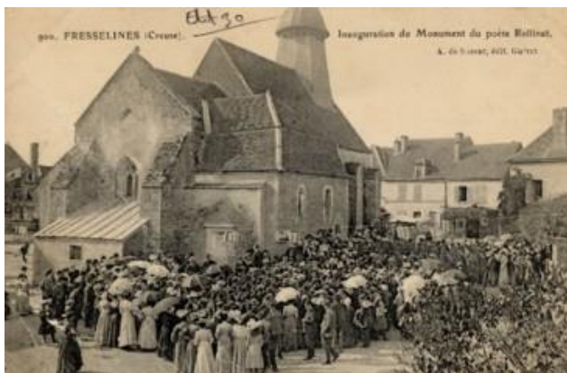
Inauguration du bas-relief d'Auguste Rodin en 1906

Au confluent des deux Creuse, dans un écrin de verdure où se mêlent eau, lumière, arbres et pierre, Fresselines est propice aux balades. Au gré des sentiers balisés, les visiteurs retrouvent les sites qui ont inspiré les peintres pleinairistes. L'itinéraire « Dans les pas de Monet » les guide dans la découverte du val de Puyguillon et du confluent des deux Creuse.