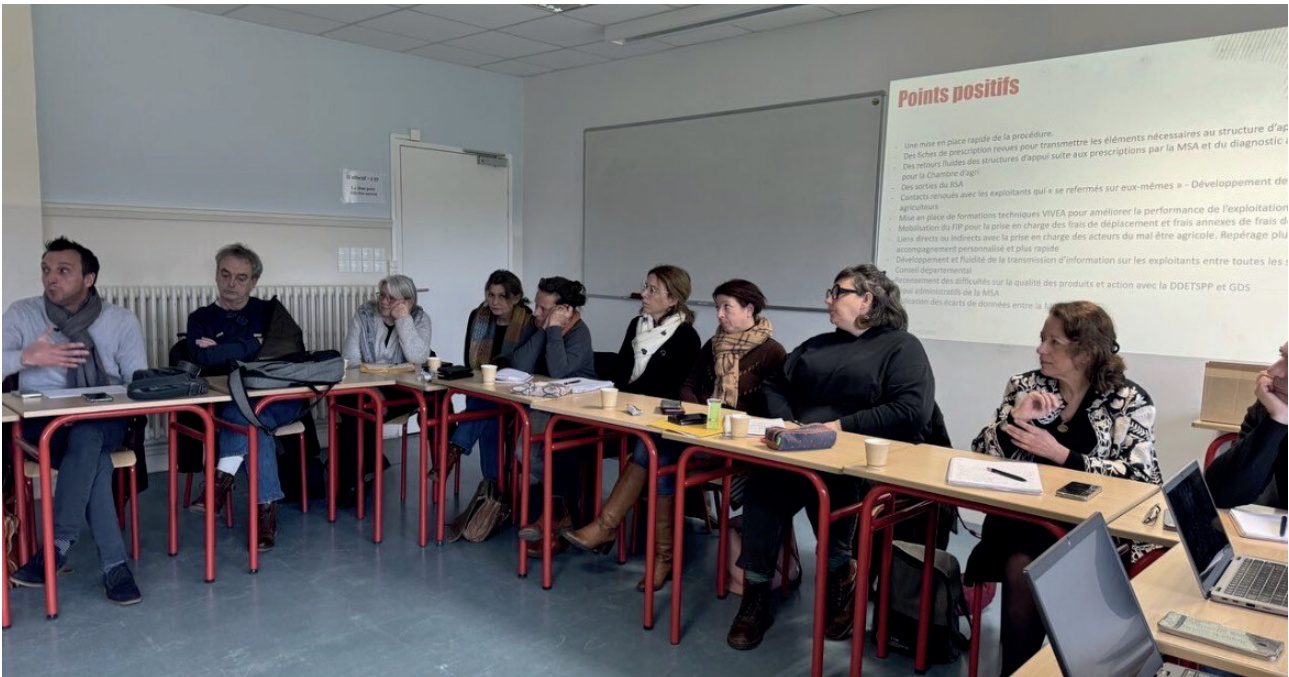
Réunion bilan de l'accompagnement des exploitants du 27 janvier au CFFPA d'AHUN