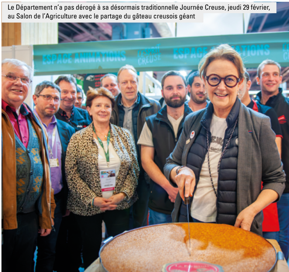
Le Département n'a pas dérogé à sa désormais traditionnelle Journée Creuse, jeudi 29 février, au Salon de l'Agriculture avec le partage du gâteau creusois géant