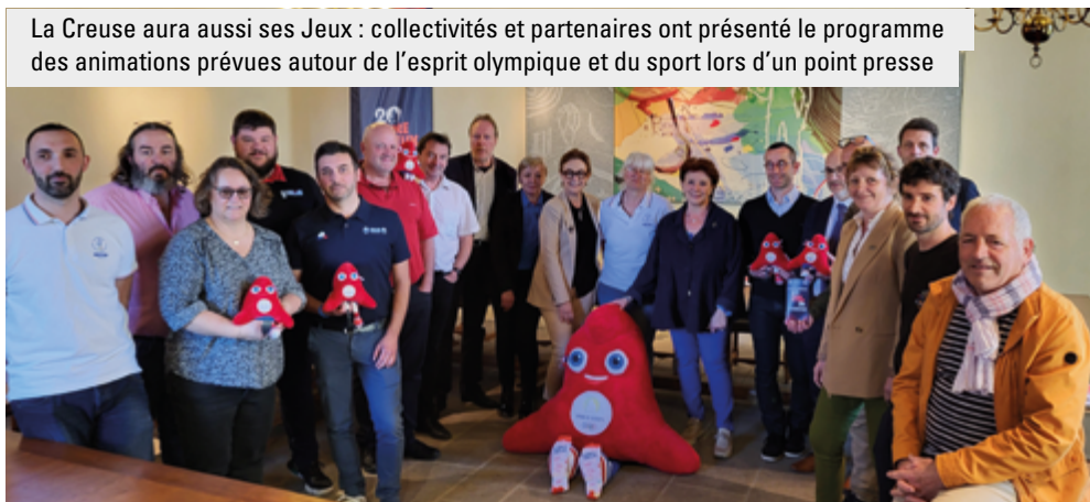
La Creuse aura aussi ses Jeux : collectivités et partenaires ont présenté le programme des animations prévues autour de l'esprit olympique et du sport lors d'un point presse