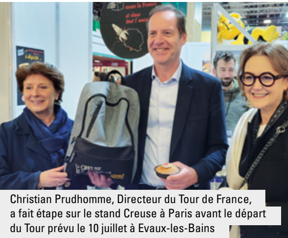
Christian Prudhomme, Directeur du Tour de France, a fait étape sur le stand Creuse à Paris avant le départ du Tour prévu le 10 juillet à Evaux-les-Bains