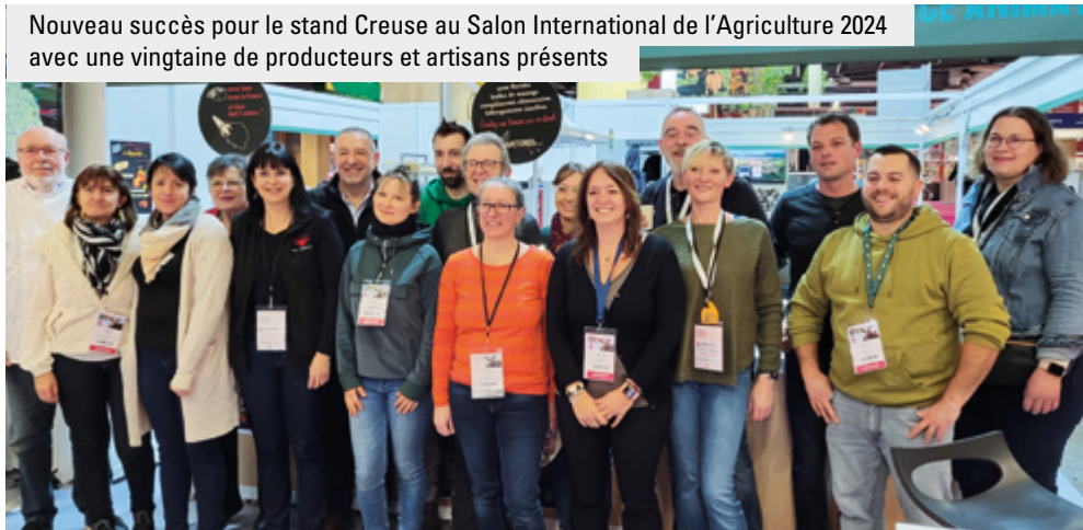
Nouveau succès pour le stand Creuse au Salon International de l'Agriculture 2024 avec une vingtaine de producteurs et artisans présents