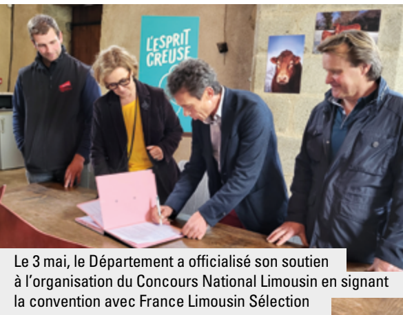
Le 3 mai, le Département a officialisé son soutien à l'organisation du Concours National Limousin en signant la convention avec France Limousin Sélection