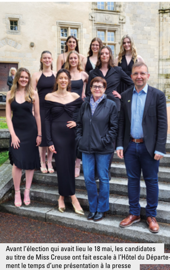
Avant l'élection qui avait lieu le 18 mai, les candidates au titre de Miss Creuse ont fait escale à l'Hôtel du Département le temps d'une présentation à la presse