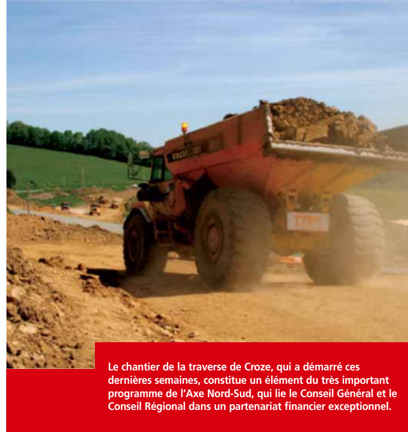
Le chantier de la traverse de Croze, qui a démarré ces dernières semaines, constitue un élément du très important programme de l'Axe Nord-Sud, qui lie le Conseil Général et le Conseil Régional dans un partenariat financier exceptionnel.

cas des travaux actuellement engagés sur la RD982, entre Le Masbet et Le Tarderon (communes de Saint-Quentin-la-Chabanne et Croze). Pour les 3,2 km de route à réaliser, le coût a été estimé à 2,8M€ ; le Conseil Régional doit intervenir à hauteur de 50%, l'Europe (FEDER) à 12,5%, le reste étant financé par le Conseil Général.