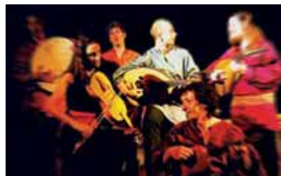
L'Espagne entre Orient et Occident, avec l'Ensemble Convivencia, le 26 juillet à Felletin.

devrait sans aucun doute ravir une fois encore le public, de plus en plus nombreux aux rendez-vous proposant cette association originale entre la polyphonie et le patrimoine creusois. Le thème retenu en 2004 est celui des Renaissances. Pour les organisateurs de "Voix d'Été en Creuse", "ces Renaissances englobent des compositeurs européens, du Moyen Âge à la Renaissance, et évoquent le renouveau culturel mais aussi les ombres et les lumières, les bouillonnements d'un monde en marche". Parmi les sonorités qu'on pourra découvrir cet été en Creuse, citons le Chœur byzantin de Grèce, le fado du Portugal, des chants andalous ou bien encore des musiques traditionnelles du Mali. Pour l'ADIAM 23, "ces chants, reflets de la civilisation,