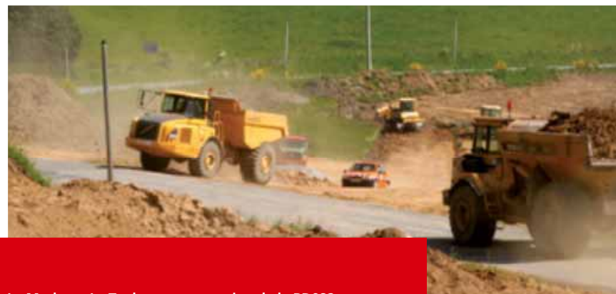
Le Masbet - Le Tarderon : une section de la RD982 toute neuve et sécurisée sur 3,2 km, d'ici moins d'un an.

Autant dire qu'un tel programme nécessite des investissements que le Conseil Général, seul, aurait bien du mal à financer. C'est tout l'intérêt d'avoir obtenu une participation accrue de la Région, dans le cadre du PRIR (programme routier d'intérêt régional, voir encadré). Et c'est le