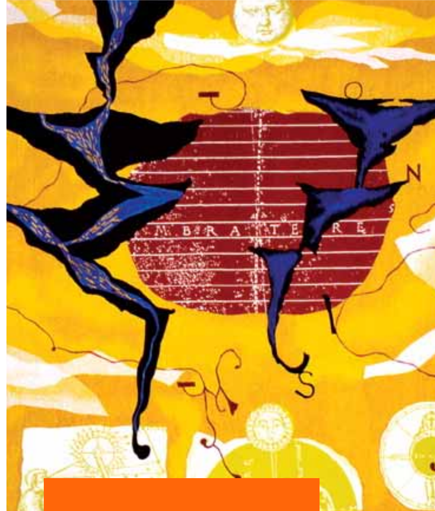
La conviction du navigateur, de Richard Texier, Manufacture Pinton - Felletin (2000), collection du Conseil Régional de Poitou-Charentes.