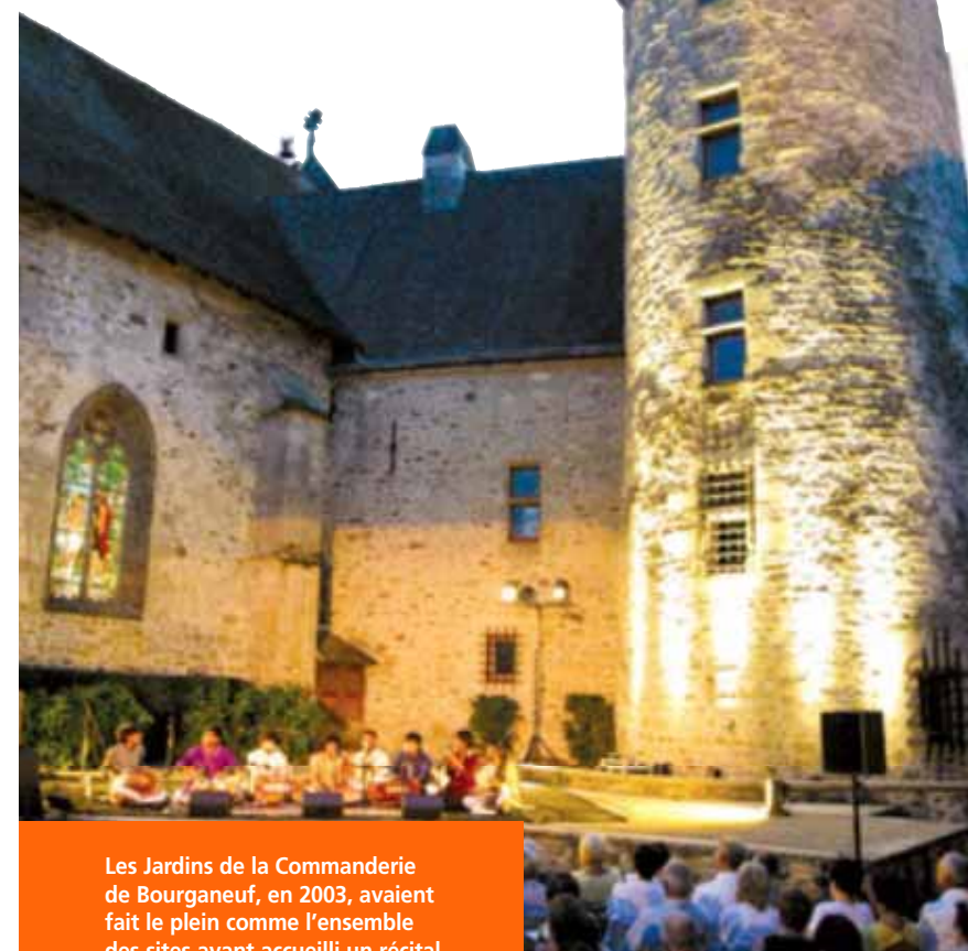
Les Jardins de la Commanderie de Bourgneuf, en 2003, avaient fait le plein comme l'ensemble des sites ayant accueilli un récital des Voix d'Été.

nous ouvriront les portes de traditions immémoriales avec quelques étoiles naissantes à découvrir...". Quant aux lieux retenus pour cette 19 ème édition, ils constituent toujours des éléments du patrimoine roman et des sites naturels dont la beauté ont été préservés au cours des