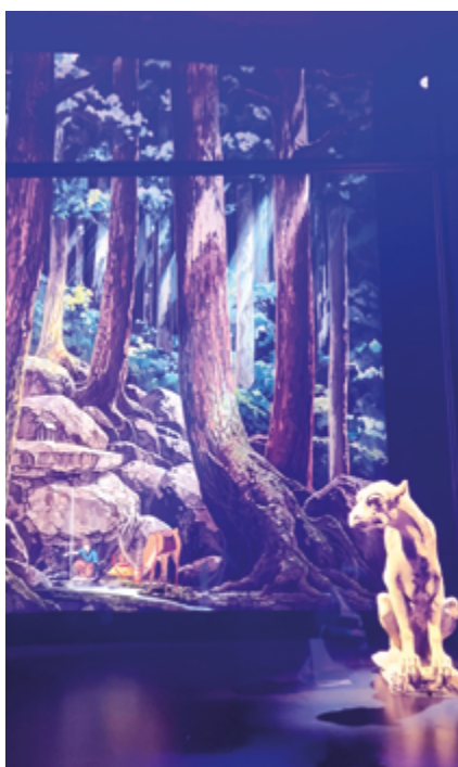
"Ashitaka soulage sa blessure démoniaque"

Tapisserie, issue du film Princesse Mononoké