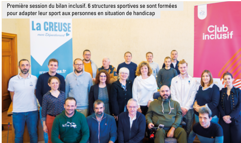
Première session du bilan inclusif. 6 structures sportives se sont formées pour adapter leur sport aux personnes en situation de handicap