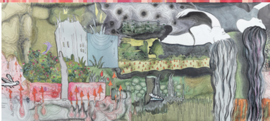
Extrait du carton de la tapisserie d'Aubusson "George" en cours de tissage, d'après l'œuvre de Françoise Pétrovitch ; carton Delphine Mangeret