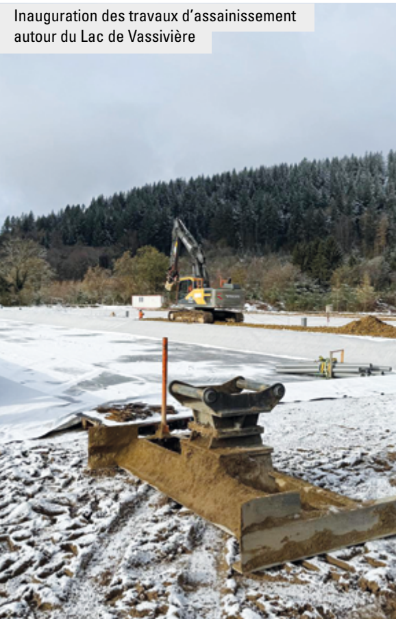
Inauguration des travaux d'assainissement autour du Lac de Vassivière