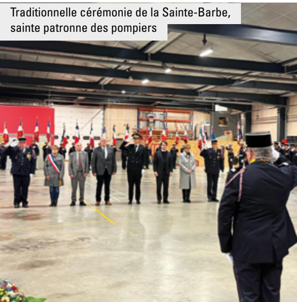
Traditionnelle cérémonie de la Sainte-Barbe, sainte patronne des pompiers