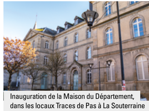
Inauguration de la Maison du Département, dans les locaux Traces de Pas à La Souterraine