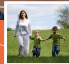
Schéma Départemental Enfance, Jeunesse, Famille