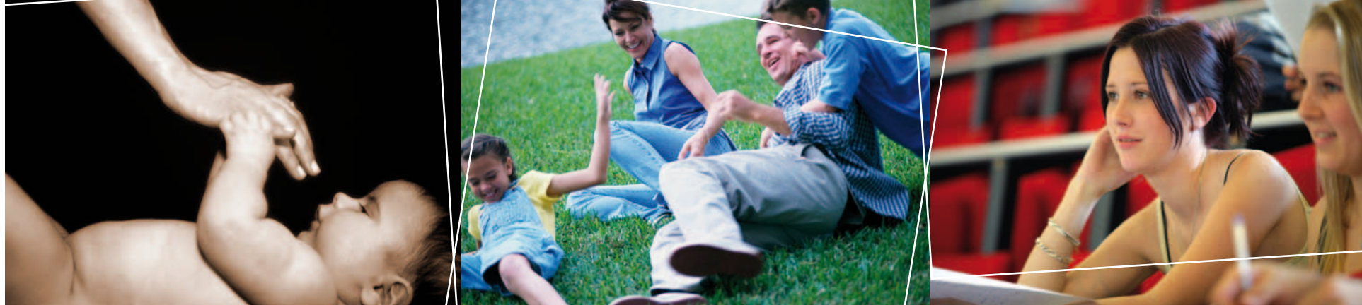
Schéma « Enfance, Famille, Jeunesse » : des priorités partagées

L'adoption des schémas départementaux relatifs à l'organisation sociale et médico-sociale est une obligation réglementaire. Mais, au delà de cet aspect très formel, leur élaboration constitue surtout une réelle opportunité. Les deux schémas "enfance, famille et jeunesse" et "personnes en perte d'autonomie" sont ainsi le résultat d'une démarche très volontariste et d'un partenariat très étroit. Le Département reste naturellement garant de leur mise en œuvre pour les années 2010 à 2015. Un des objectifs précisément du présent document est de permettre à chacun d'appréhender les travaux en cours et de disposer des repères incontournables pour les prochaines années. En effet, à travers ces documents de programmation, l'enjeu fondamental reste celui de l'adaptation de nos outils d'intervention aux projets de vie des personnes en perte d'autonomie et au renouvellement des générations pour l'enfance, la famille et la jeunesse. Ces schémas traduisent finalement la solidarité départementale en direction des personnes les plus fragiles mais, ô combien précieuses, soit pour leur expérience, leur humanité ou leur devenir pour les plus jeunes.