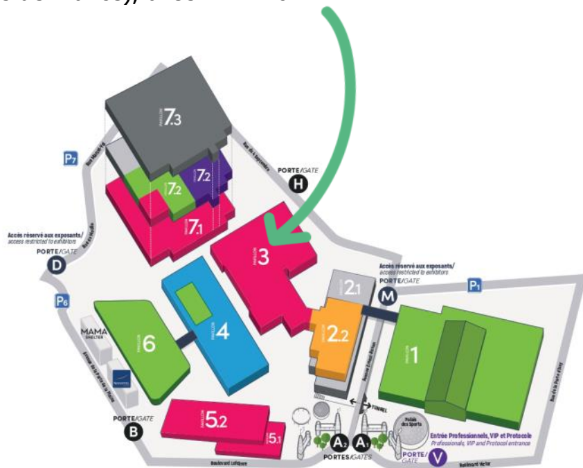
Plan arrêté au 31/07/2023, susceptible de modifications / Plan as at 2023/07/31 subject to modifications

Il sera situé au sein de l'espace région Nouvelle-Aquitaine, dans le Hall 3 (Produits et saveurs de France), allée B n°110.